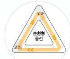
04. 공간을 하나의 동선으로 연결하다.