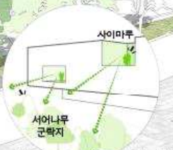
07. 자연과 함께하는 마루에서 휴식하다.