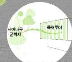
05. 주변의 자연경관과 어우러지다.