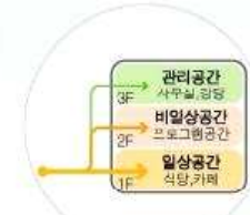
03. 가장 가까이에서 일상공간을 만나다.