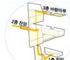
02. 접근이 편리한 복지관이 되다.