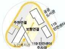
01. 공공 클러스터의 체계를 만든다.