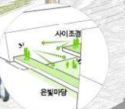
08. 서도들 바라보며 하나가 되다.