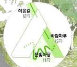
06. 다양한 마당으로 만나다.